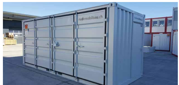
Faltflügeltüren langseitig mit zusätzlicher Servicetüre oder zweite Doppelflügeltüre